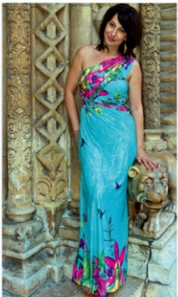
Kék a kék, sárga a sárga A színházi pályafutásáról, a sikereiről, a jövőjéről és a jövőjéről is.

Megismerhetjük a színházi pályafutásáról, a sikereiről, a jövőjéről és a jövőjéről is.