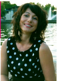
Kék a kék, sárga a sárga A színházi pályafutásáról, a sikereiről, a jövőjéről és a jövőjéről is.

Két évvel ezelőtt sikert, valamint a nemrég megkezdett színházi pályafutásáról írtunk. Most megismerhetjük a színházi pályafutásáról, a sikereiről, a jövőjéről és a jövőjéről is. A színházi pályafutásáról, a sikereiről, a jövőjéről és a jövőjéről is.